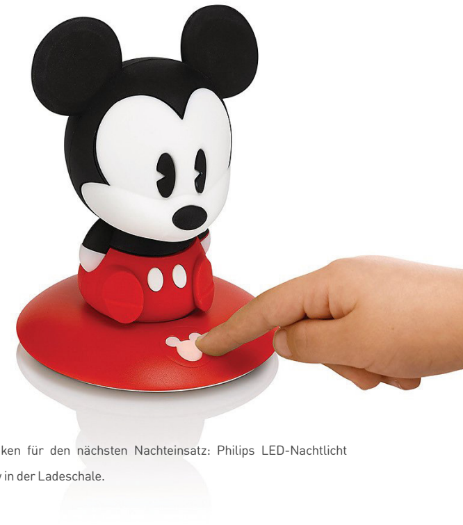
Auftanken für den nächsten Nachteinsatz: Philips LED-Nachtlicht Mickey in der Ladeschale.

Auch mit geladenem Akku können die LED-Nachtlichter in ihrer Ladeschale sitzen und leuchten. Dort haben sie einen festen Platz im Zimmer und Ihr Kind findet seinen leuchtenden Freund auf Anhieb. Die Akkulaufzeit beginnt erst, wenn das Nachtlicht nicht mehr in der Ladeschale steht.